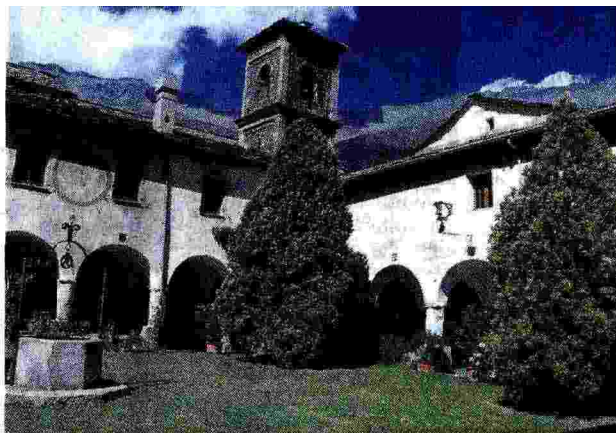
Qui sopra: l'abbazia di Novalesa. A sinistra: la Sacra di San Michele. Sotto: la cappella di Sant'Andrea alla Ramats (Chiomonte)