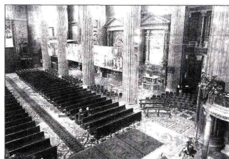
La navata di destra della Cattedrale dove si aprirà il nuovo cantiere di restauri, al centro un particolare eloquente dello stato delle volte e, a destra l'interno del Duomo, transennato da gennaio nelle navate laterali